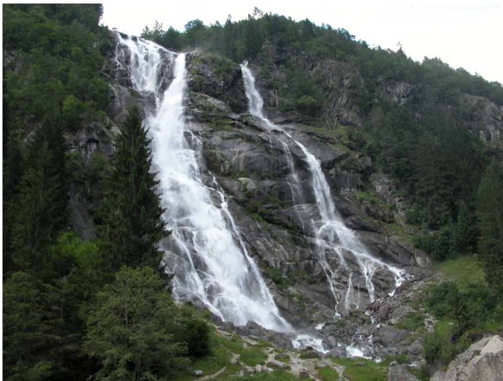
Cascate NARDIS Val di GENOVA Parco ADAMELLO BRENTA