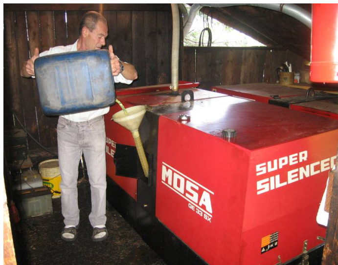
Particolari del generatore Diesel da 30kW

in quali lavorano solo per poche e determinate ore al giorno, inoltre il DGS può integrare in batteria (grazie ai caricabatteria inseriti negli inverter) una buona fetta di energia per garantire la completa carica della batteria ogni giorno.