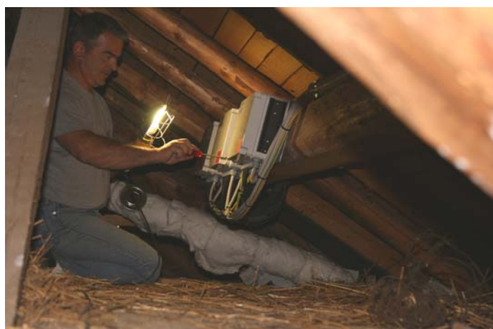
Installazione delle JUNCTION BOXES