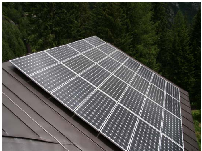
Campo fotovoltaico completato