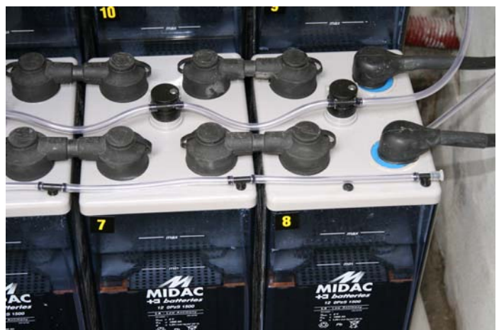
Particolare dei tappi a "sfiato esterno" e dei "tubi di rimescolamento elettrolito"