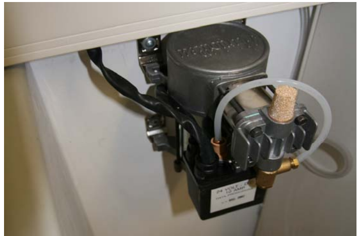
Compressore per sistema antistratificazione NST2