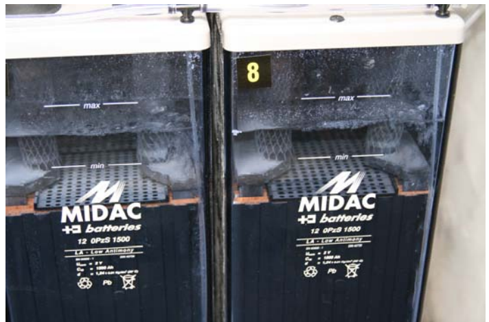
Effetto di rimescolamento elettrolita