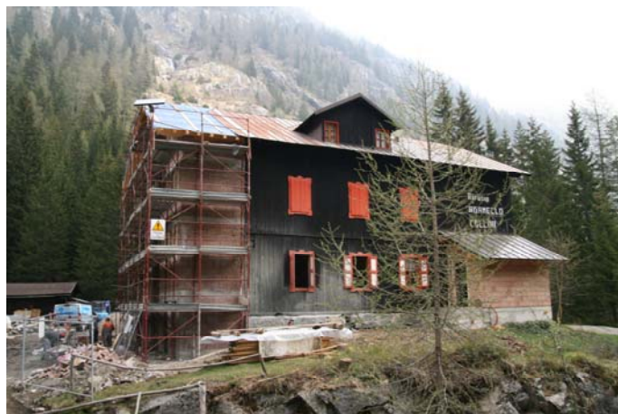
Particolari della ristrutturazione dell'edificio

- possibilità di usufruire di bus navetta con partenza da Ponte Maria, gestiti dal Parco Naturale Adamello Brenta.