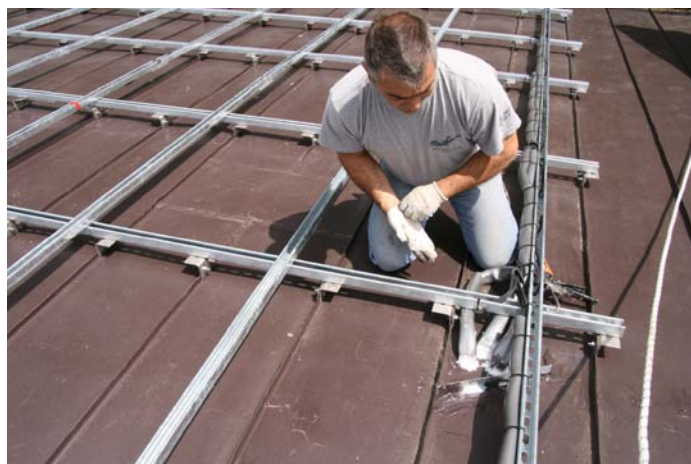
Disposizione delle strutture di supporto sulla falda