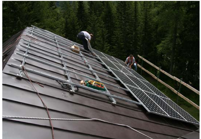
Installazione dei moduli fotovoltaici