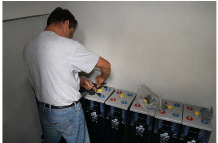
Installazione delle batterie di accumulo