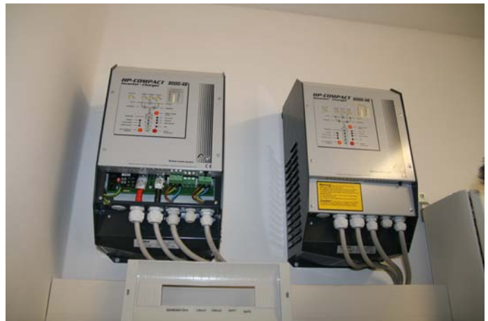
I due Inverters HPC8000-48 da 8kVA ciascuno