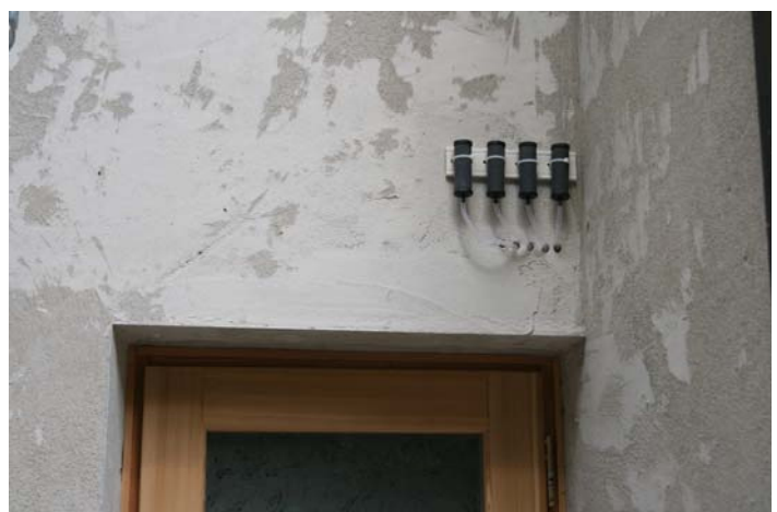
Particolare filtri esterni del sistema a tappi con sfiato all'esterno dei vapori di carica e scarica della batteria