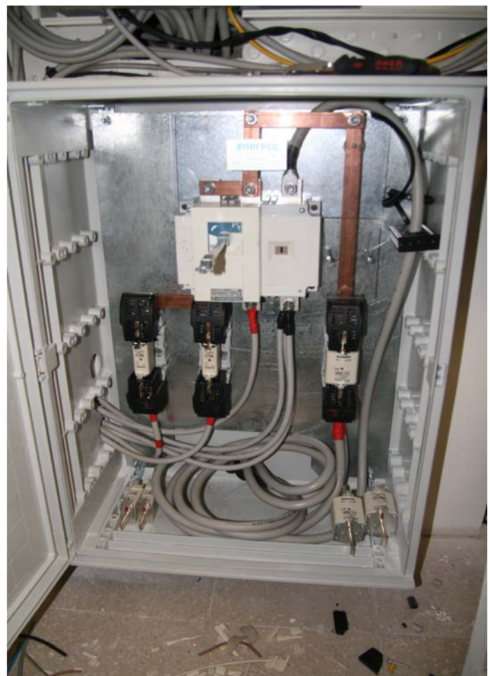
Particolare del quadro di potenza DC