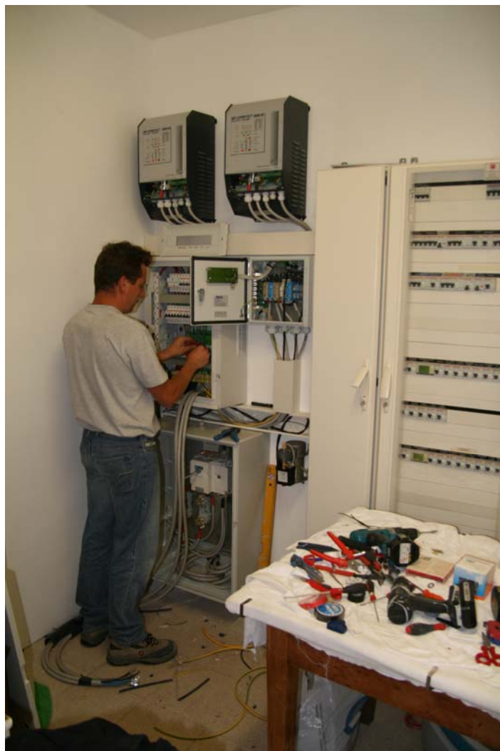
Installazione Quadri e Inverters